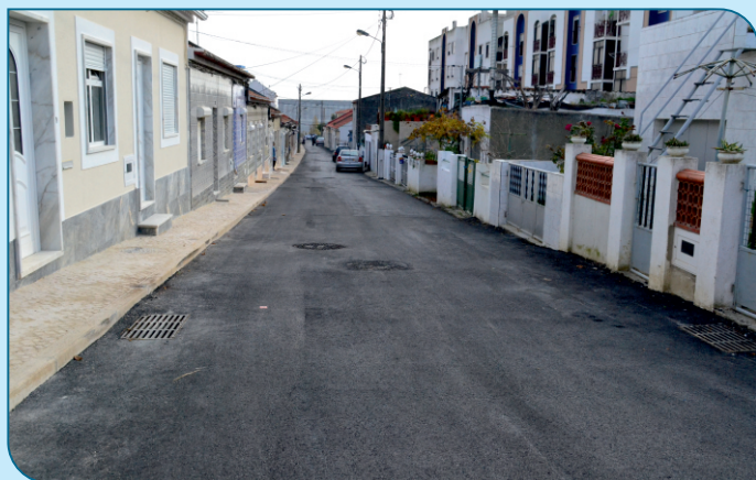
Após a intervenção do SMAS a nível do subsolo, na Rua de Santo António, foi colocado um novo tapete e um passeio com vista a melhorar a segurança dos peões.