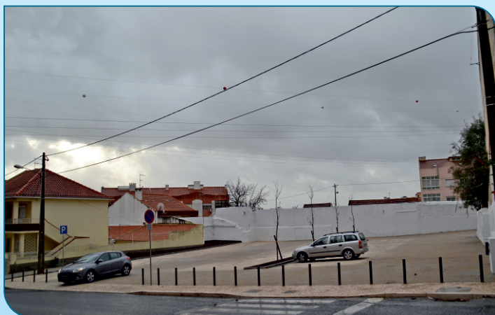
Conclusão das obras do parque de estacionamento no antigo Pátio do Silvino no Bom Sucesso.

Além do reforço de marcação de lugares de estacionamento... criaram-se novos parques.