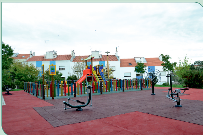
FAIAS - ARCENA

T ratou-se dum investimento superior a 25.000 €, totalmente suportado por verbas próprias da Junta de Freguesia.