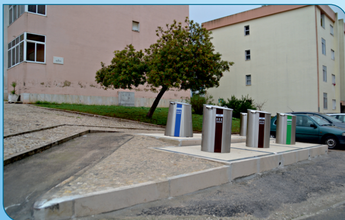
Colocação de ilha ecológica na Rua Maria Lamas em Arcena.