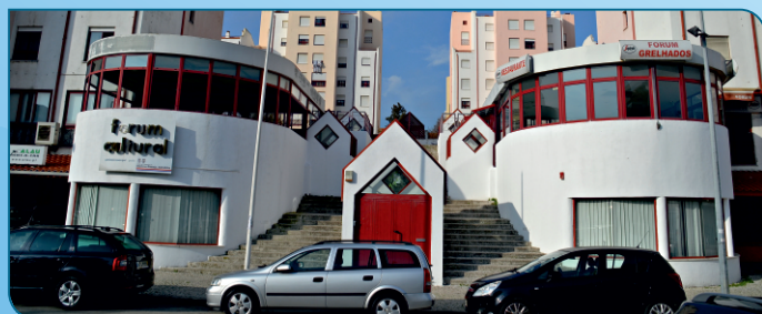
Pintura e restauração do exterior do Fórum da Chasa.