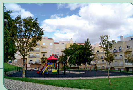
RUA IVONE SILVA - ARCENA

O investimento rondou os 9.000 € e foi suportado, tal como a requalificação da Praceta das Faias, na sua totalidade, com verbas próprias da autarquia.