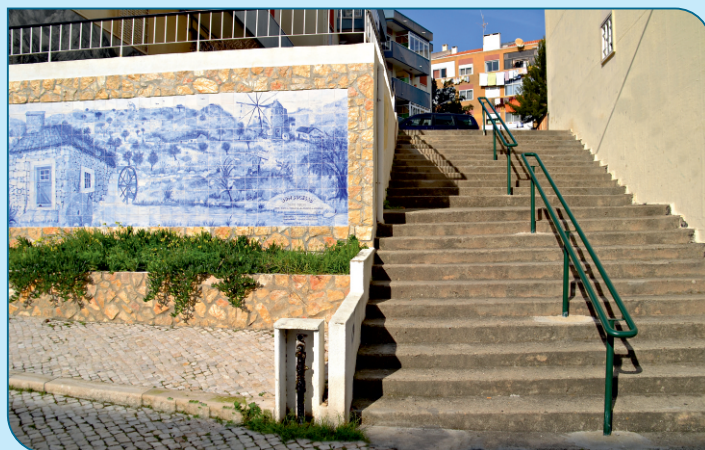
Colocação de corrimão na escadaria da Praceta José Régio para a Rua Soeiro Pereira Gomes no Bom Sucesso.