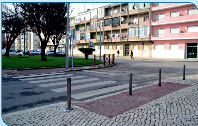
Rebaixamento de passeios no acesso a passadeiras nas Ruas da Aviação, Gago Coutinho, Rua Vasco da Gama, Fernando Pessoa e José Veríssimo da Silva e acesso à Rua do Comércio.

Neste âmbito, são muitas as intervenções executadas ao longo do território.