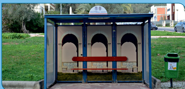
Foram requalificados os abrigos de passageiros no Sobralinho e colocados novos abrigos na Estrada de Arcena/cruzamento com a Rua Alves Redol (Bom Sucesso), na EN10 junto ao Edifício da Alfândega e na EN10.6, junto ao Bairro do Estacal.