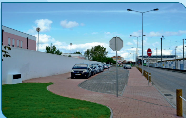
Construção de parque de estacionamento a tardoz da Escola Pedro Jacques de Magalhães com capacidade para 52 lugares.