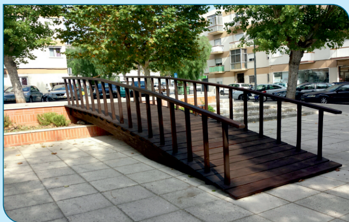
Requalificação e manutenção da Ponte da Cova do Bicho e colocação e mobiliário urbano no local.