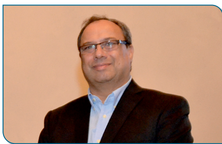
Afonso Costa Presidente da Junta de Freguesia de Alverca do Ribatejo e Sobralinho

O papel dos “Companheiros da Noite” no apoio a pessoas na situação de sem abrigo e da Policia de Proximidade em parceria com a Câmara Municipal e Centro de Saúde, na sinalização de idosos isolados tem sido uma constante.