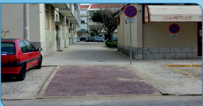
Construção de acesso a veículos de emergência e transporte de doente à Praceta nº 2 da Quinta das Drogas.