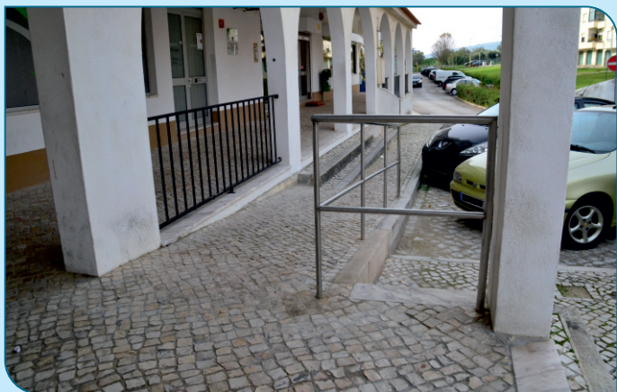
Colocação de um corrimão, varandim e criação de uma rampa junto do Largo da Fonte no Sobralinho.