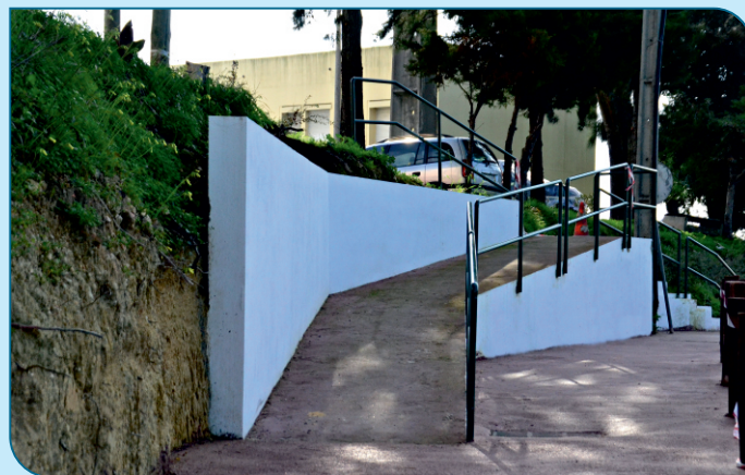
Construção de Rampa no aceso ao caminho pedonal da Rua Srª da Graça.