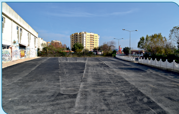
Requalificação do espaço lateral do Pavilhão Municipal com construção de novo parque de estacionamento.