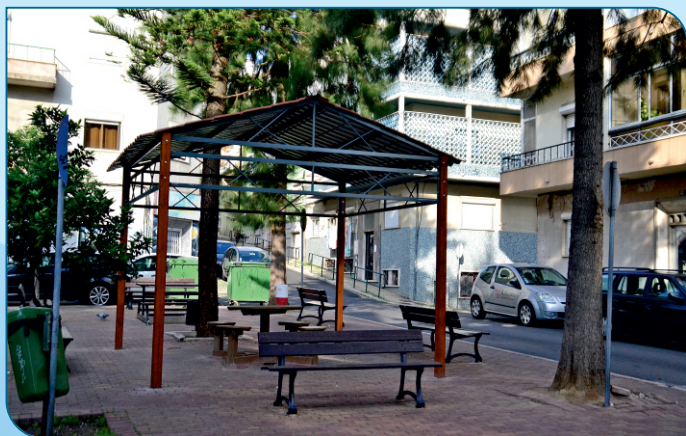
Colocação de um abrigo e mobiliário urbano no Largo da Rua José António do Carmo (antigo largo dos CTT), com vista a proporcionar espaços de estar e lazer à população.