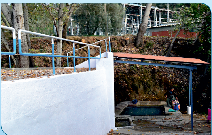
Requalificação do telheiro nos lavadouros no Sobralinho. Pintura do muro em seu redor.