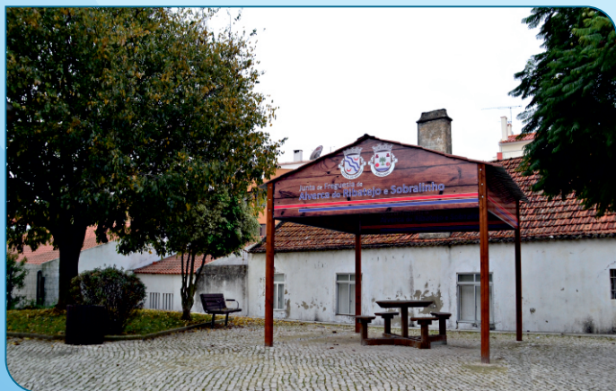
Colocação de um abrigo e espaço de lazer na Rua Ivone Silva em Arcena, junto à Farmácia Raposo. Neste espaço a população sénior pode confraternizar ou jogar umas partidas de sueca.