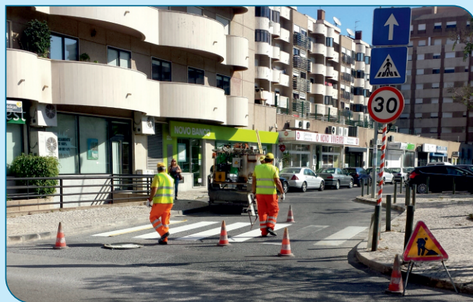
Pintura de Passadeiras ao longo de toda a freguesia.