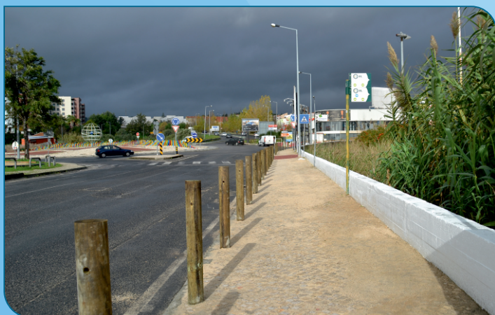
Requalificação do passeio junto da rotunda do Jumbo.