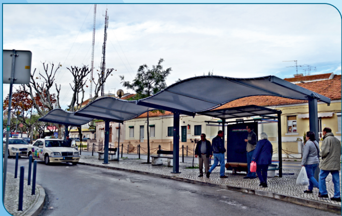
A Junta de Freguesia concretizou mais uma aspiração dos taxistas de Alverca, com a colocação do abrigo de passageiros. Quem aguarda por este meio de transporte pode agora fazê-lo de forma mais confortável. Numa segunda fase proceder-se-á à requalificação do material urbano desta artéria.