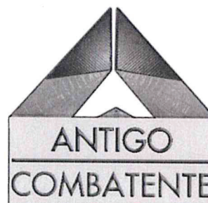
Modelo e legenda da Insígnia do Antigo Combatente

Neste momento, encontram-se em curso os procedimentos contratuais com vista à aquisição das insígnias.